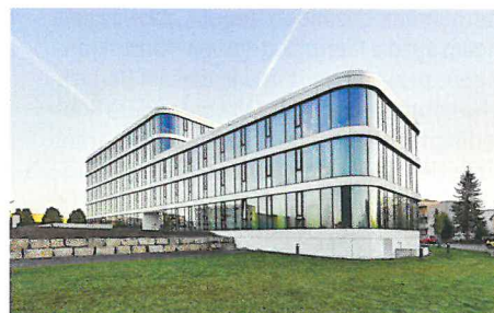
Firmensitz von All for One am Stuttgarter Flughafen. Der IT-Dienstleister unterstützt vor allem Mittelständler bei Softwareprojekten.

All for One ging bereits Ende der Neunziger (unter dem Namen AC-Service AG) an den Neuen Markt. Die Firma hat den Niedergang des Börsensegments überlebt und schreibt inzwischen seit über zehn Jahren regelmäßig schwarze Zahlen. Mit einem Jahresgewinn von lediglich 13 Millionen Euro ist die Firma für uns Wachstumsstrategen allerdings eindeutig zu klein. Nur wer deutlich höheres Risiko fahren will, zieht diese Aktie der von SAP oder Microsoft vor.