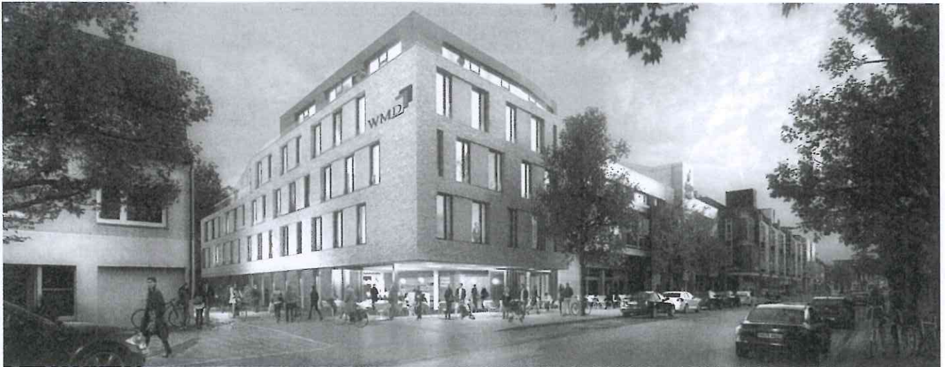
Ahrensburg, Herbst 2015: die neue WMD-Zentrale (Visualisierung).

Illumiti (Kanada), IBA (Weißrussland), SOA People (Luxemburg) und Westrocon (Südafrika) erweitern die Excellence Delivered Pvt. Ltd, Lahore/Pakistan, und die Real Consulting S.A., Athen/Griechenland, die weltweite Allianz, die 2006 von der All for One Steeb AG zusammen mit der Seidor S.A., Barcelona, gegründet wurde. Damit wächst das Netzwerk auf aktuell 26 Partner, die zusammen in 63 Ländern vor Ort sind.