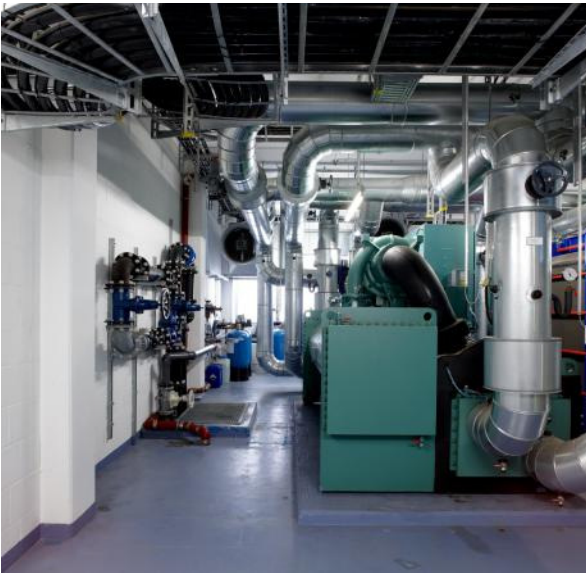
Server im Herz des Rechenzentrums