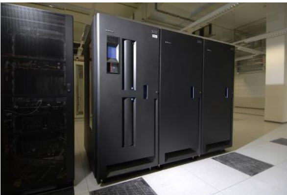
Außenansicht der Taperoboter