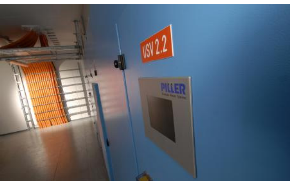
Seitenansicht der USV-Anlage