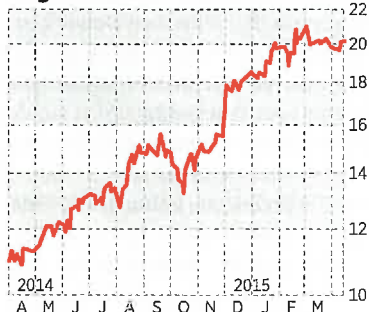
Gagfah in €

Der Ausstieg eines Großinvestors sprach vor Jahresfrist für eine Kaufgelegenheit beim Immobilienwert Gagfah . Danach lief es so gut, dass es fast schade ist, dass mit Deutsche Annington ein neuer Großaktionär einstieg, der den Konkurrenten fast vollständig übernahm. Wer es noch nicht getan hat, sollte zumindest einen Teil der Gewinne realisieren.